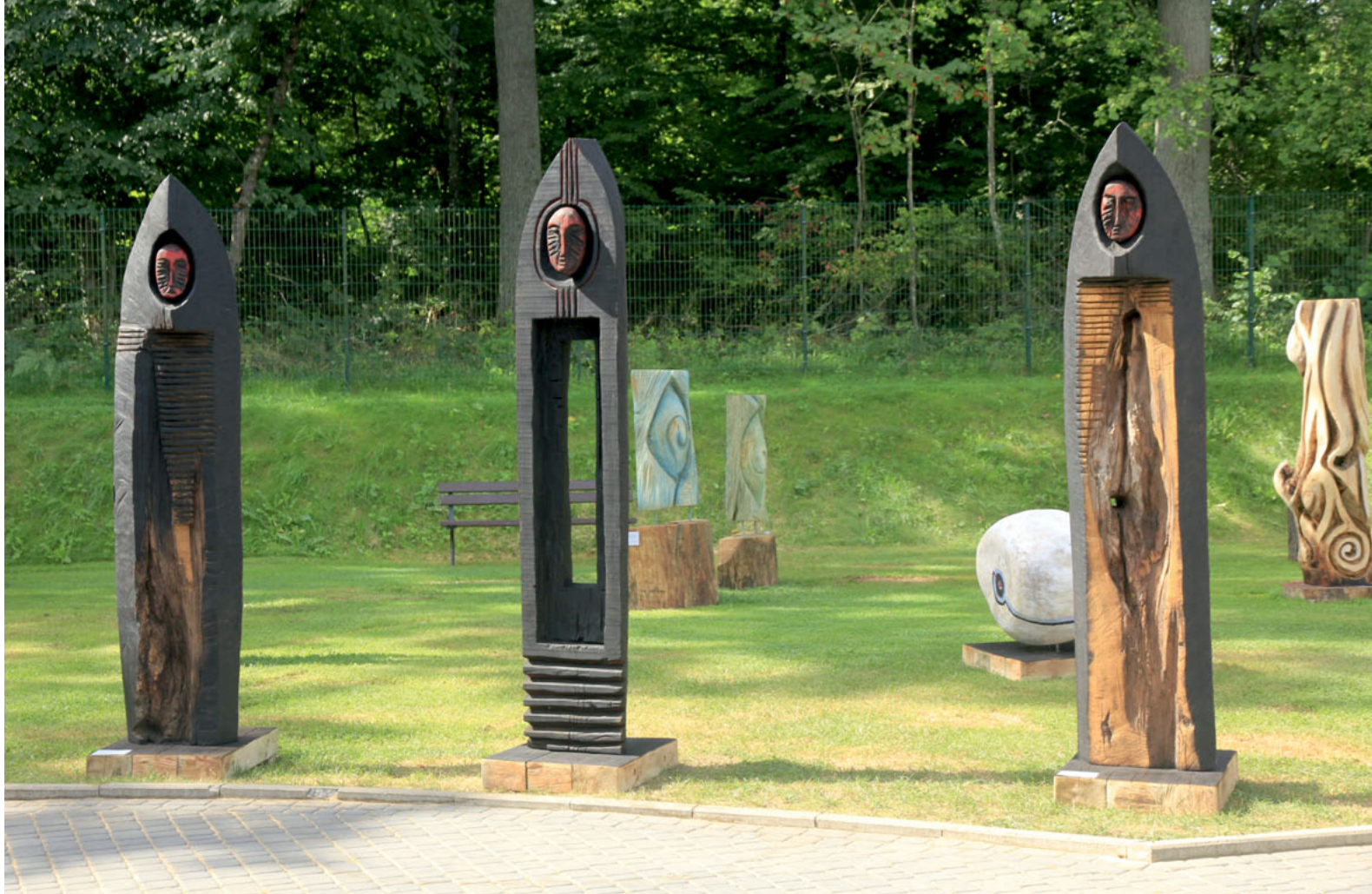
Wojciech Pawliczuk „Cienie zapomnianych przodków” (tryptyk) / a triptych - Shadows of forgotten ancestors