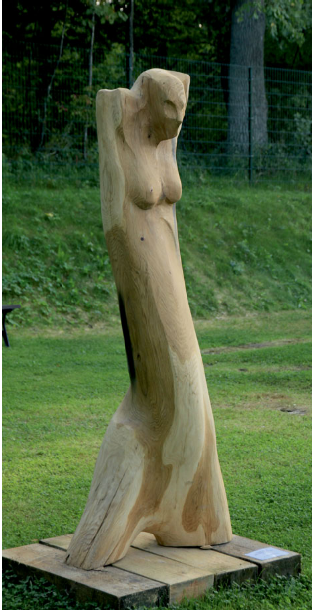
Wojciech Mendzelewski „W oczekiwaniu” / In waiting