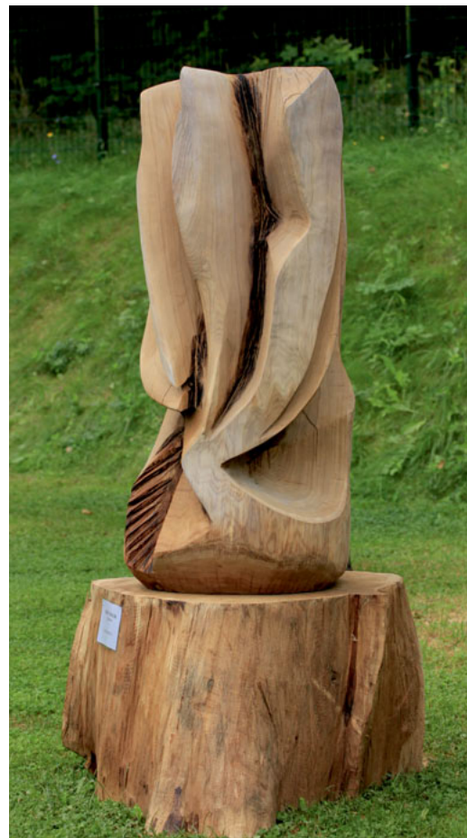
Jerzy Iwacik „Żywioty” / The Elements