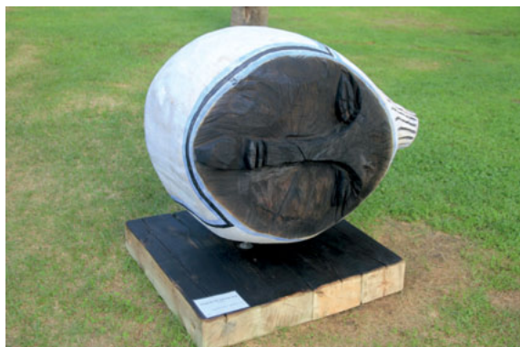
Wojciech Pawliczuk - Głowa nr1, biała / Head no 1 - white