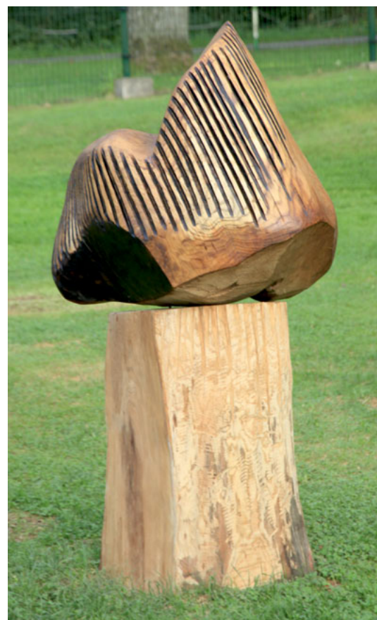
Stanisław Leszek Ostaszewski „Pozytywne wibracje” / Positive vibes