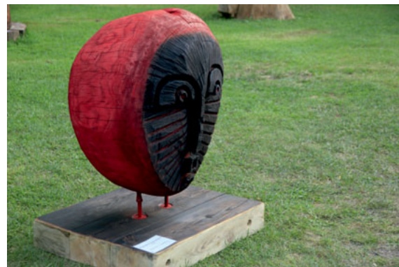
Wojciech Pawliczuk - Głowa nr2, czerwona / Head no 2 - red