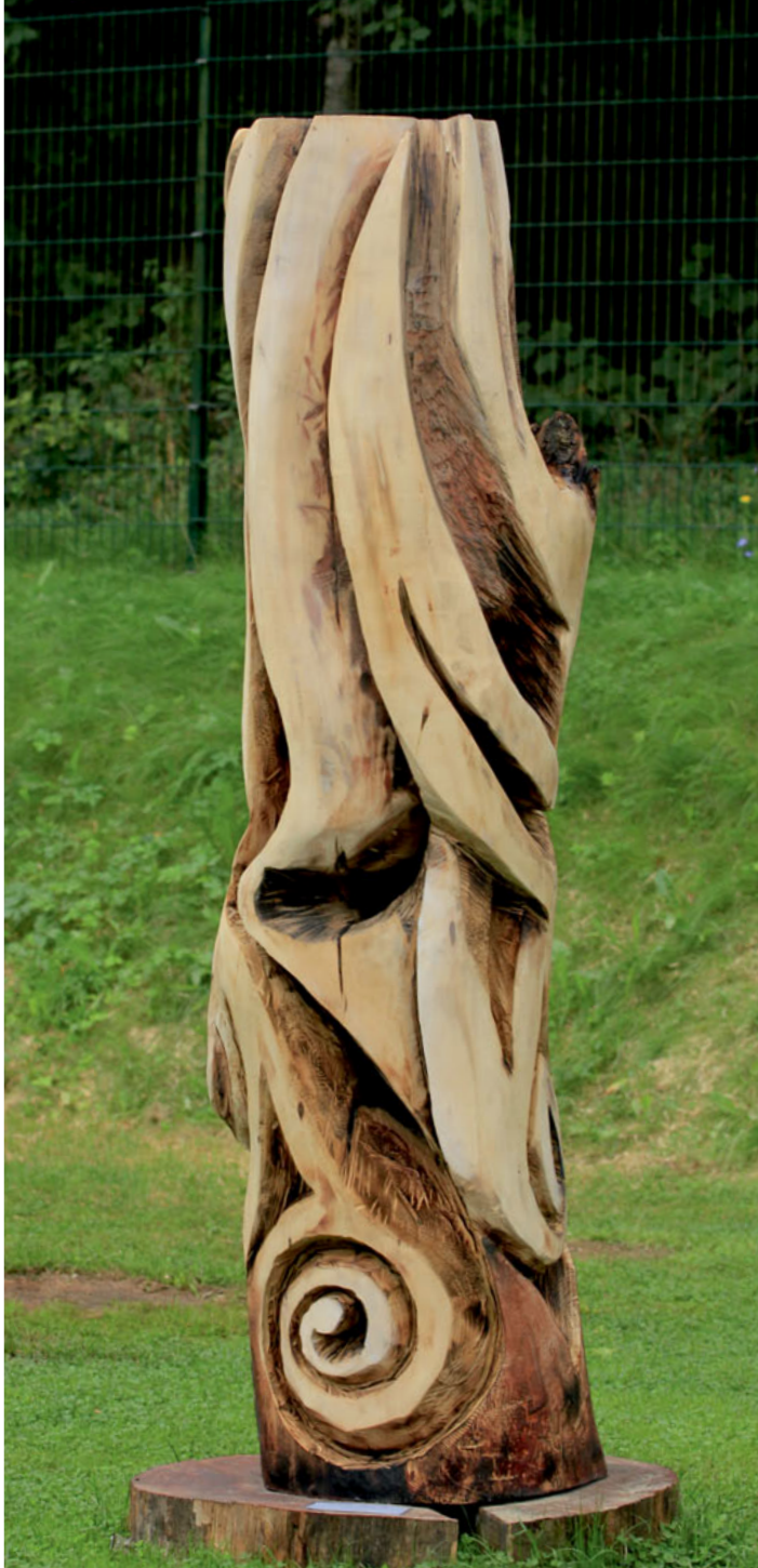
Jerzy Iwacik „Dendromorf 22” / Dendromorph 22