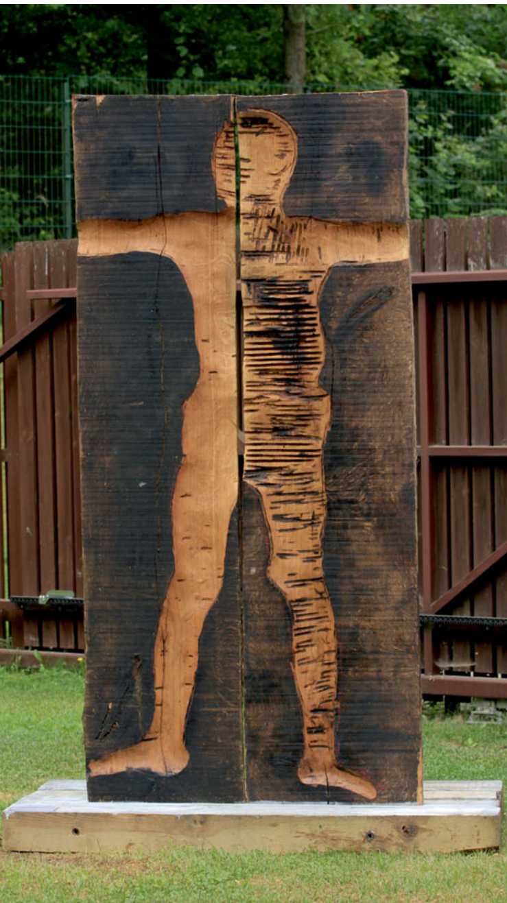
Stanisław Leszek Ostaszewski „Ślady” / Traces