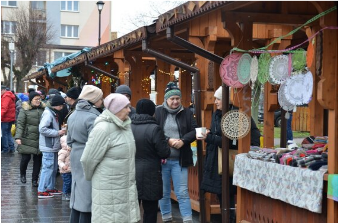
Ryneček miejski przy ul. 3 Maja w Hajnówce